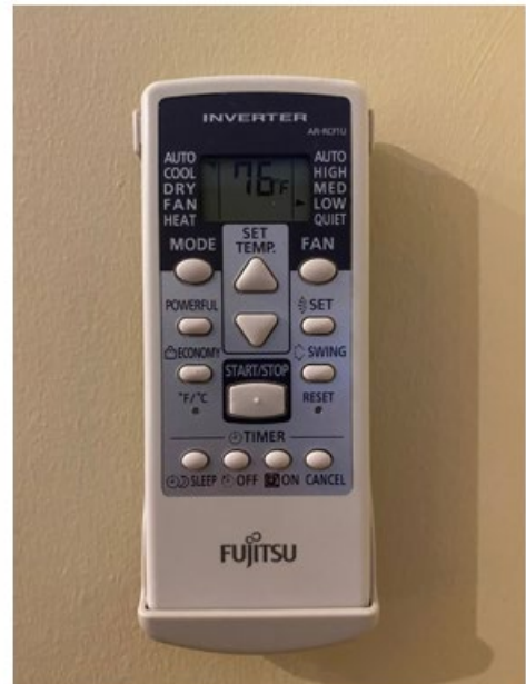
Télécommande climatiseur AC remote control