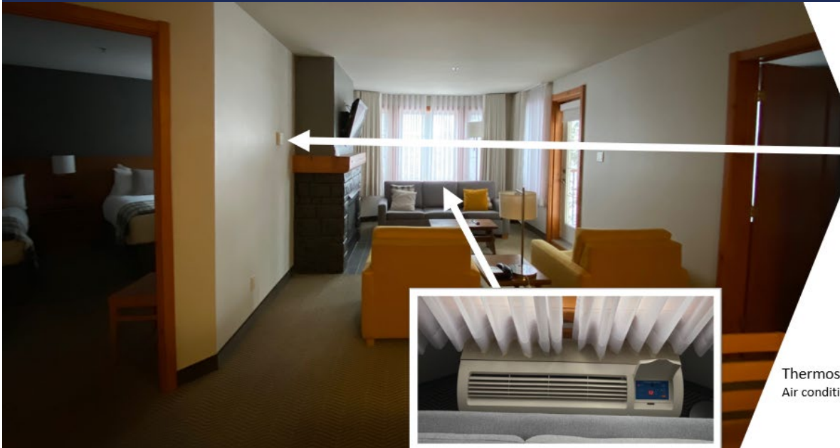
Boitier pour allumer le foyer Fireplace control panel