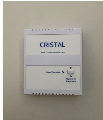
Boitier pour allumer le foyer Fireplace control panel