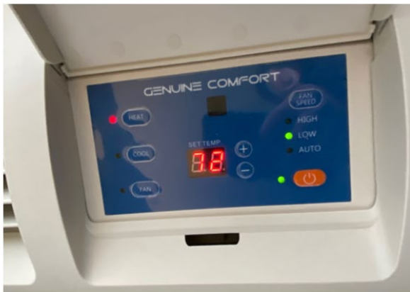
Thermostat / climatiseur Air conditioning controls