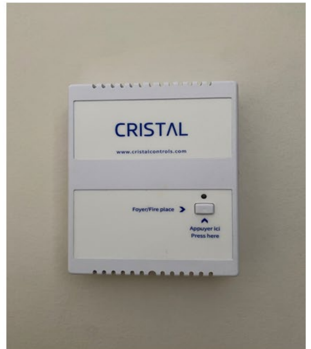
Boitier pour allumer le foyer au gaz Control for gas fireplace