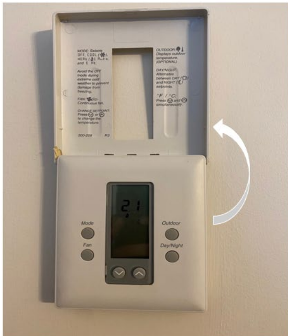
Boitier du climatiseur/chauffage Air conditioning controls